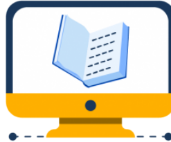
EJE DE MEDICIÓN