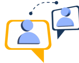
EJE DE PARTICIPACIÓN